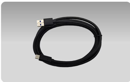
USB 케이블 USB 타입-C / 1.5 M